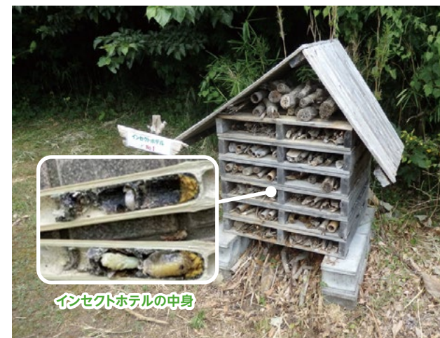
インセクトホテルの中身