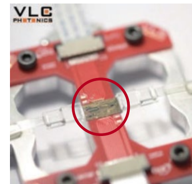
実際の光集積回路(PIC)